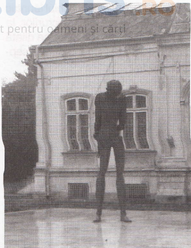
Statuia lui G. Bacovia din Bacău, orașul natal al poetului

„Dacă în primele lui volume putem accepta că recuzita simbolistă este susținută la modul modernist de o formalizare textuală înaltă (simetrii, elipse, redundanță semnificativă etc.), mai greu de justificat prin poetica de acest tip sunt ultimele dezvoltări ale poeziei bacoviene: versuri «prozoice», plate, destructurate, pline de inserturi «livrești», așa cum le găsim în volumele Stanțe burgheze sau Versete . [...] Sintagmele orale, lipsa totală a metaforei, a încifrării, a «sensului secund», notația fulgurantă, «descriptivă», configurează o poezie «gestuală», a improvizăției, aleatorului, accidentalului [...].